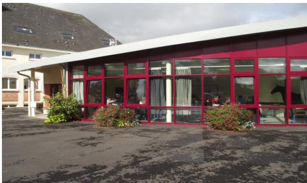
La verrière, salle de 60 m 2 , 1 évier à disposition